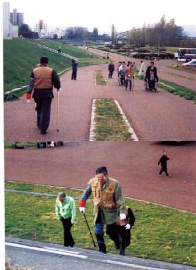
11月11日に行われた「福祉の川づくり懇談会」の現地視察会

これらの整備を行うことによつて、 子供から高齢者、健常者から障害者 までのすべての人に利用され、愛さ れる川となる可能性を持っています。 旭川開発建設部では平成11年11月 11日から、この考え方に基づいて 「福祉の川づくり懇談会」を設け、 整備計画の検討を行うとともに、現 地視察会や体験会を行つて、その体 験をアンケートにまとめ、これを参 考にすることによつて、より人にや さしい川づくりを目指しています。