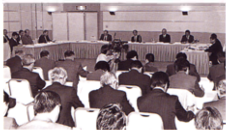
第1回「千歳川流域治水対策全体計画検討委員会」