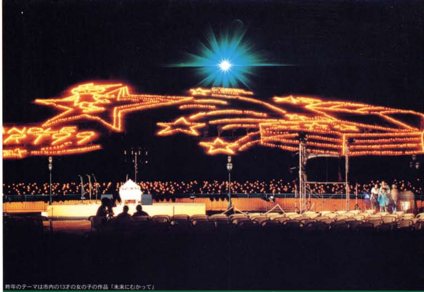
昨年のテーマは市内の13才の女の子の作品「未来にむかって」