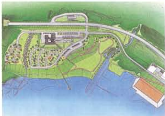
オートキャンプ場、コテージ、人工ビーチ等を配置した親水公園