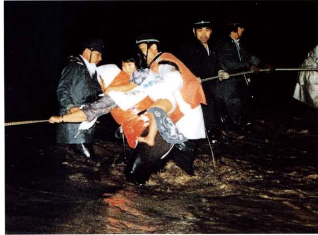
大きな被害をもたらした昭和56年8月の洪水。