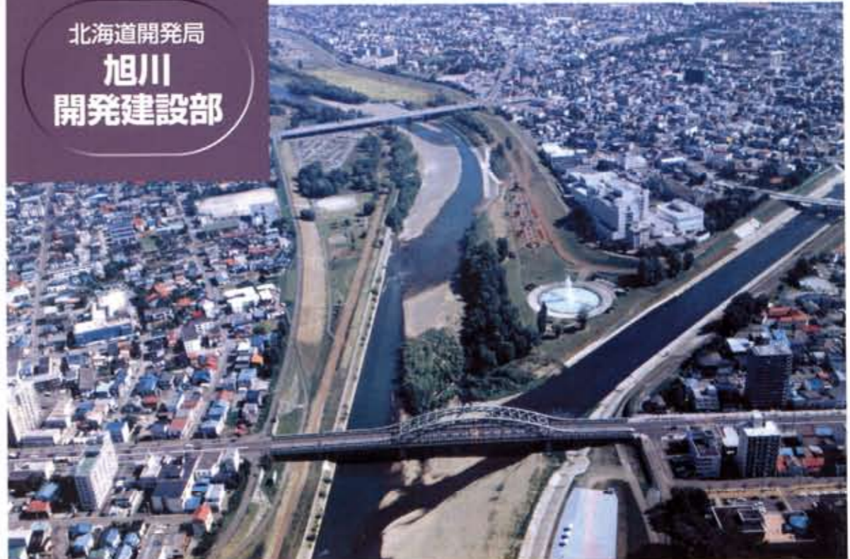
市街地を流れる牛朱別川。人にやさしい空間を目指す