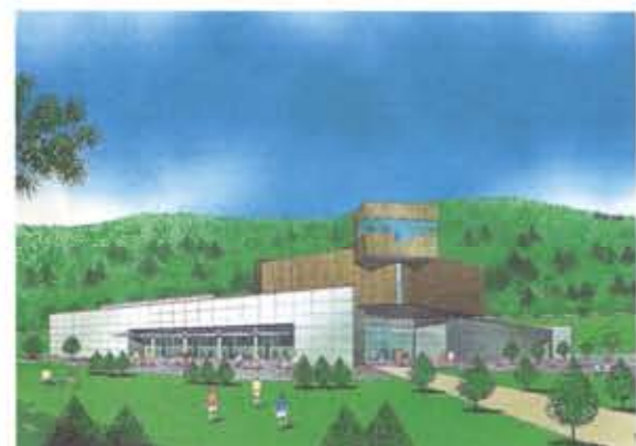
湖底に沈んだ滝里町を後に残す資料等を展示した「ダム資料館」

新しい時代に動き出した 憩いの水辺 ダム建設によって出現した湖は、一般公募によって「滝里湖」と名付けられました。湛水面積は約680haあります。 この「滝里湖」周辺の豊かな自然を生かした憩いの空間が、新たに3カ所誕生します。 一つはダム下流の公園広場で、約5万㎡の緑地を主体とした公園で、ダム下流を眺望する優れた場所となっています。